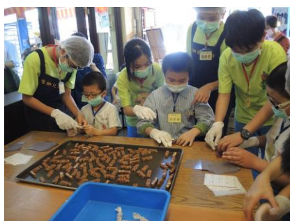
資源與特教學生包裝體驗