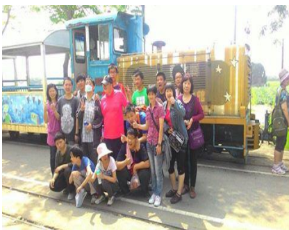
戶外教學-溪湖糖廠