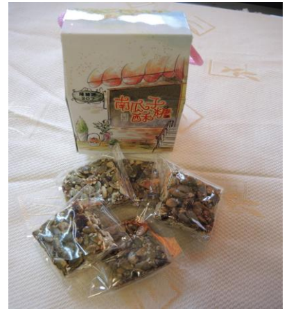
新產品-南瓜子酥糖