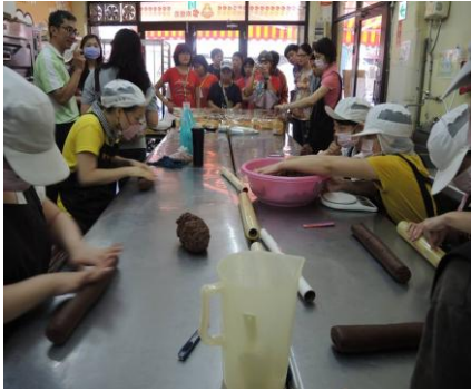
和美實驗學校國三特教班參訪