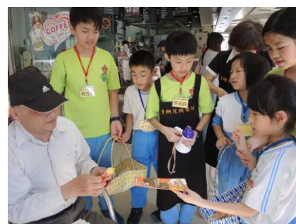
資源與特教學生沿街販售