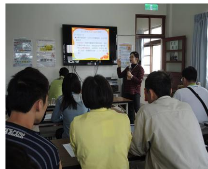
家庭托顧、臨托服務解說