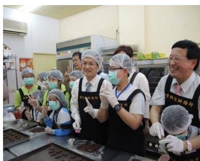
縣長與資源班學生餅乾壓模