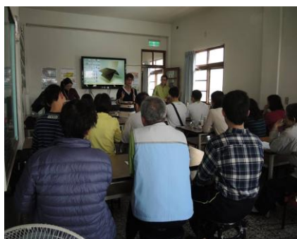
數位學習系統介紹