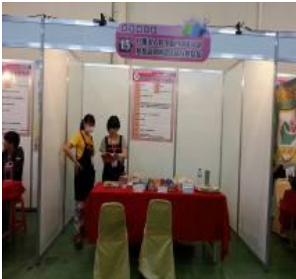
身心障礙者就業博覽會擺攤