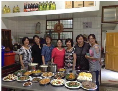
一日廚娘準備午餐給學員吃