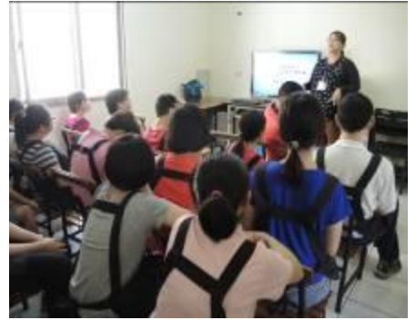
職業災害防制宣導會