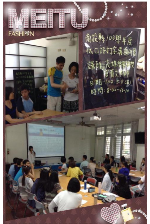
參加南投低口語打字研習