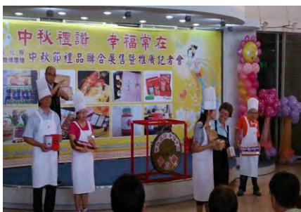
中秋禮盒-推廣記者會