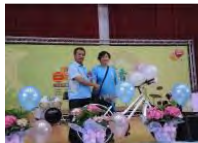
昱荏媽媽抽中腳踏車