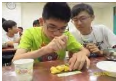
金牌大廚師-地瓜圓製作