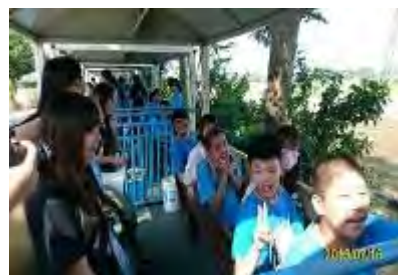
溪湖糖廠-五分車之旅]