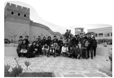
《大統》觀光食用油工廠