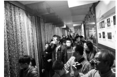
《緙陽》觀光緞帶工廠